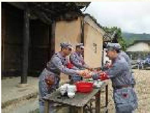
中复村长征出发仪式