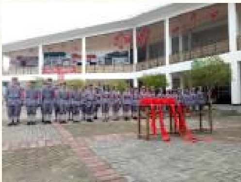
古田红军小镇参军仪式