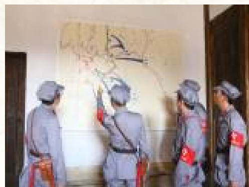
郭公寨前线指挥部现场教学