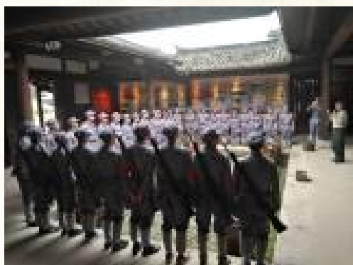
古田会址现场教学